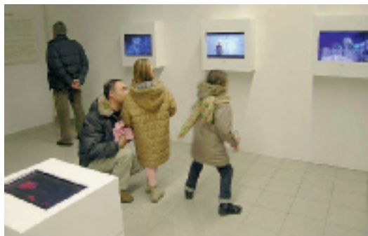
UN MONDO FANTASTICO Bambini in visita alla bellissima mostra sulle favole

— CECINA — ARTE e bambini: la sorprendente mostra sul mondo delle favole alla Fondazione Geiger di Cecina sta riscuotendo davvero un gran successo. Conoscere la storia dell'uomo attraverso le favole accompagnati da Topolino, Biancaneve, Cappuccetto Rosso ma anche personaggi dei film animati di oggi come il pesciolino Nemo, Shrek ed Harry Potter e poi i grandi miti e le leggende