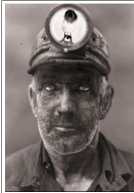
Un minatore del West Virginia, 1944.